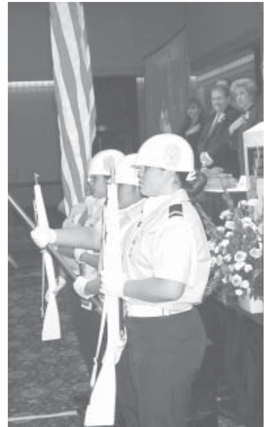
A color guard from the South San Antonio High School ROTC opens the National Migrant Education Conference. Un guardia de color de la High School ROTC del Sur de San Antonio inaugura la Conferencia Nacional Educación para Migrantes.

Después fue el Equipo de Historia, formado por alumnos de 10mo. grado, incluyendo dos alumnos de educación especial. Ellos derrotaron al equipo senior dominante en su propia escuela. Derrotaron a todas las otras escuelas de California. Y ganaron una medalla de plata en las nacionales.