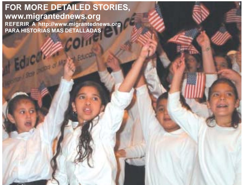
Members of the Scheh Mustangs Choir of the Harlandale, Texas, Independent School District perform enthusiastically before the National Migrant Education Conference. Miembros del Coro Scheh Mustangs del Distrito Escolar Independiente de Harlandale, Texas, en entusiasta presentación ante la Conferencia Nacional de Educación para Migrantes.

FOR MORE DETAILED STORIES, www.migratednews.org REFERIR A http://www.migratednews.org PARA HISTORIAS MAS DETALLADAS