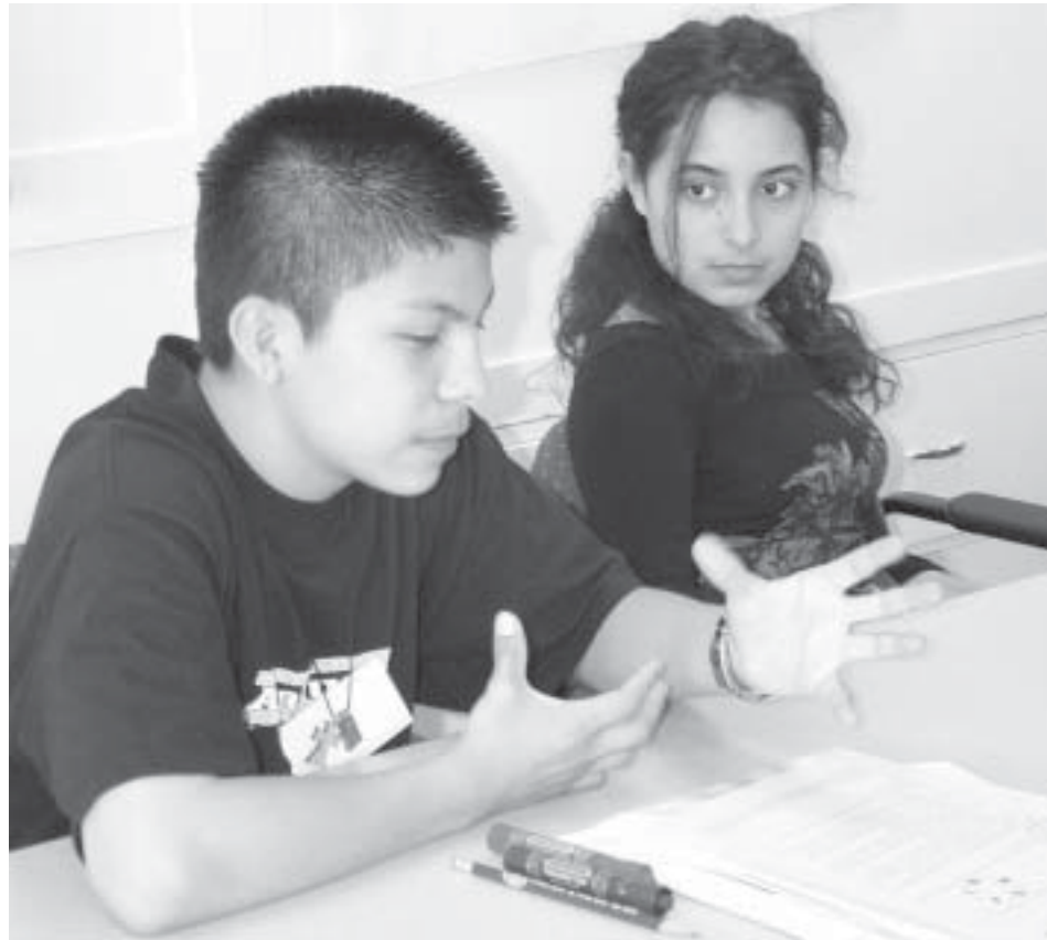
Migrant students at the Yakima School District Leadership Conference discuss problem-solving techniques. Estudiantes migrantes en la Conferencia de Liderazgo del Distrito Escolar de Yakima discuten técnicas de solución de problemas.

Cuando los distritos desarrollen sus propios programas, el personal de SEMY espera reducir su intervención y redirigir sus esfuerzos a nuevos distritos.