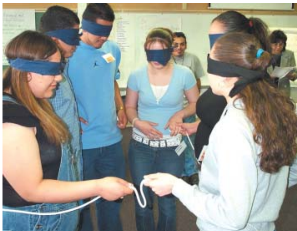
Migrant students at Yakima School District's Leadership Conference try to create a square with their rope while blindfolded. Con los ojos vendados, los estudiantes migrantes tratan de crear un cuadrado con la cuerda durante la Conferencia de Liderazgo del Distrito Escolar de Yakima.